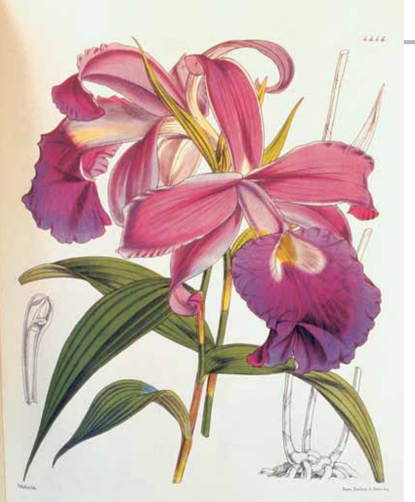
Sobralia rogersiana Abbildung aus / illustrated in the Botanical Magazine (als / as Sobralia macrantha , t. 4446).