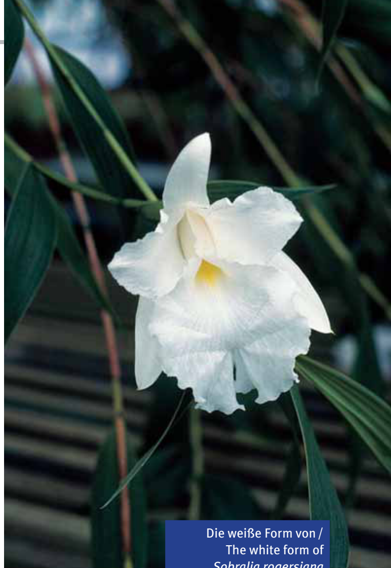
Die weiße Form von / The white form of Sobralia rogersiana Züchter / grower: RBG Kew

Etymology: Named for San Francisco Bay area Sobralia enthusiast and hybridist Bruce ROGERS who provided the type specimens.