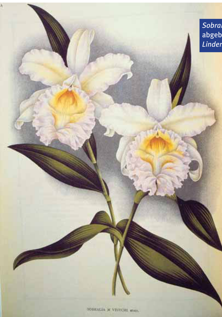
Sobralia Veitchii abgebildet in / illustrated in Lindenia (t. 740)

So the name Sobralia Veitchii is tagged to a naturally occurring hybrid even though all historic records of the name actually refer to a different hybrid parentage. The vagaries of taxonomy when working with such a horticulturally important group.